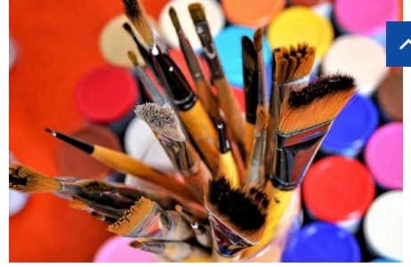
UN RITRACCO SULLA CIMA DI MILANO