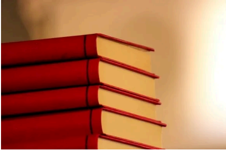
NUOVA VITA ALLA BIBLIOTECA